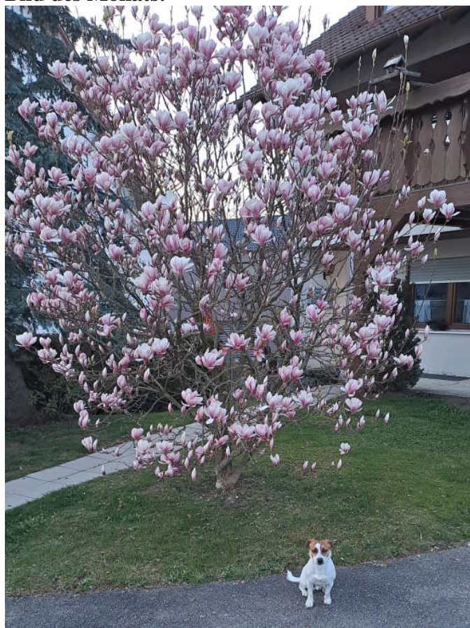
Bild: Stephan Hörmann aus Weinried. Die Magnolie wird von Seppi bewacht.

Das nächste Gemeindeblatt erscheint voraussichtlich am 30.04.2024 . Redaktionsschluss ist der 26.04.2024 um 9 Uhr.